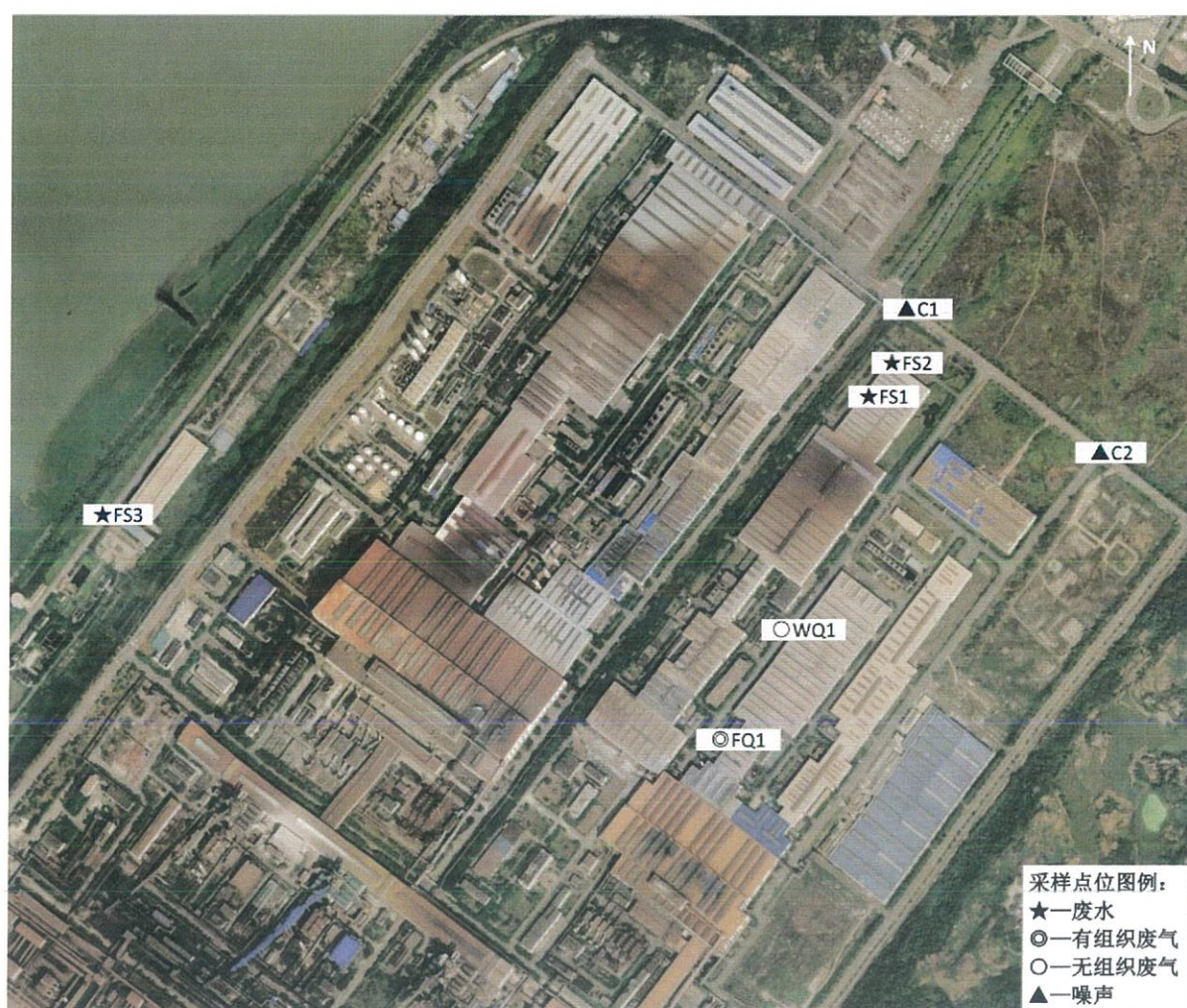
图 1 厂区平面布点图